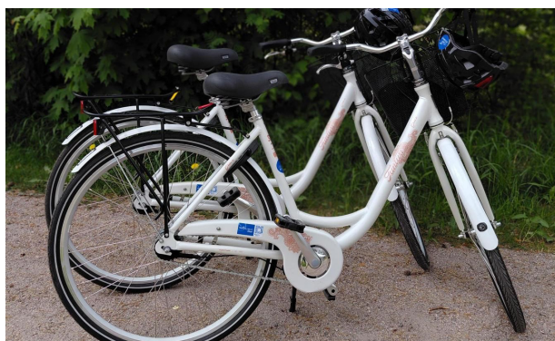
Elinvoimakeskus Kairasta voi lainata nyt myös polkupyörän käyttöösi Kairan aukioloaikoina.