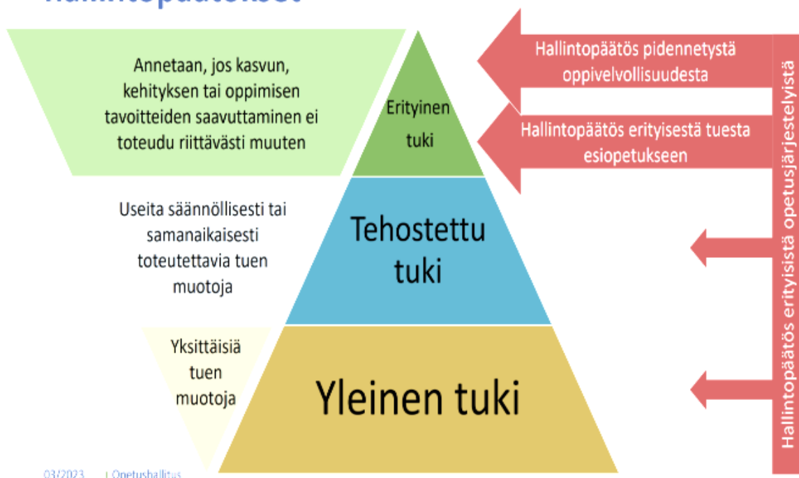
Kuva 5. Esiopetuksen tuen muodot ja hallintopäätökset (OPH)