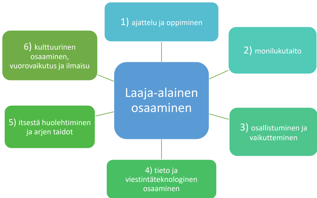
Kuva 2. Laaja-alainen osaaminen