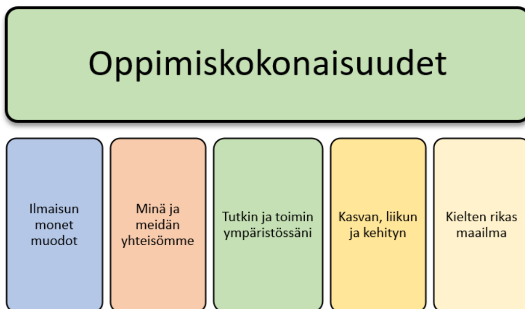
Kuva 3. Oppimisen alueet esiopetuksessa

Esiopetukselle on asetetut yhteiset tavoitteet, jotka perustuvat valtakunnallisen esiopetussuunnitelman perusteisiin. Kokonaisuuksia on viisi, johon kuhunkin kokonaisuuteen on koottu tavoitteita, joilla on toisiinsa liittyviä opetuksellisia ja kasvatuksellisia tehtäviä. Eri kokonaisuuksien tavoitteita ja sisältöjä yhdistellään pedagogisesti tarkoituksenmukaisella tavalla esiopetuksen oppimiskokonaisuuksiksi. Oppimiskokonaisuuksia ovat: 1. Ilmaisun monet muodot, 2. Minä ja meidän yhteisömme, 3. Tutkin ja toimin ympäristössäni, 4. Kasvan, liikun ja kehityn ja 5. Kielen rikas maailma.