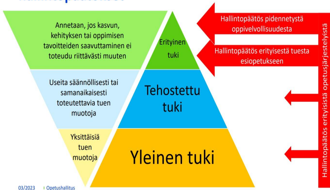
Kuvio 3. Esiopetuksen tuki