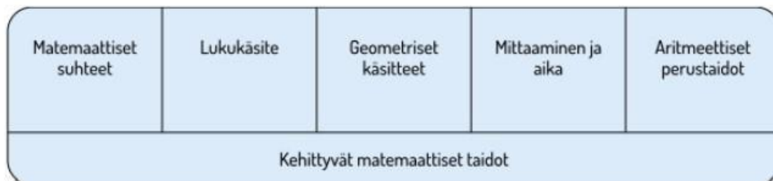
KUVIO 2. LASTEN MATEMAATTISEN KEHITYKSEN KESKEISET OSA-ALUEET ESIOPETUKSESSA

ongelmanratkaisutaitoja ja toimintaa. Toiminta suunnitellaan niin, että se tarjoaa lapselle mahdollisuuksia opetella ja käyttää matemaattisia käsitteitä, luokitella, vertailla, asettaa järjestykseen asioita ja esineitä sekä löytää ja tuottaa säännönmukaisuuksia. Opetukseen kuuluu muistia ja loogista ajattelua kehittäviä leikkejä ja tehtäviä. Opetus on leikillistä ja siinä hyödynnetään leikkejä, pelejä ja tarinoita sekä tieto- ja viestintäteknologiaa.