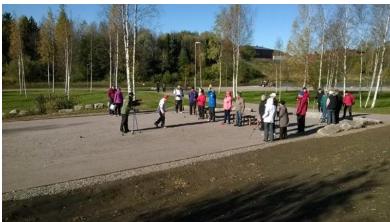
Kuvio 10. Eläkeläisjärjestön boccian peluuta Paimion Jokipuistossa