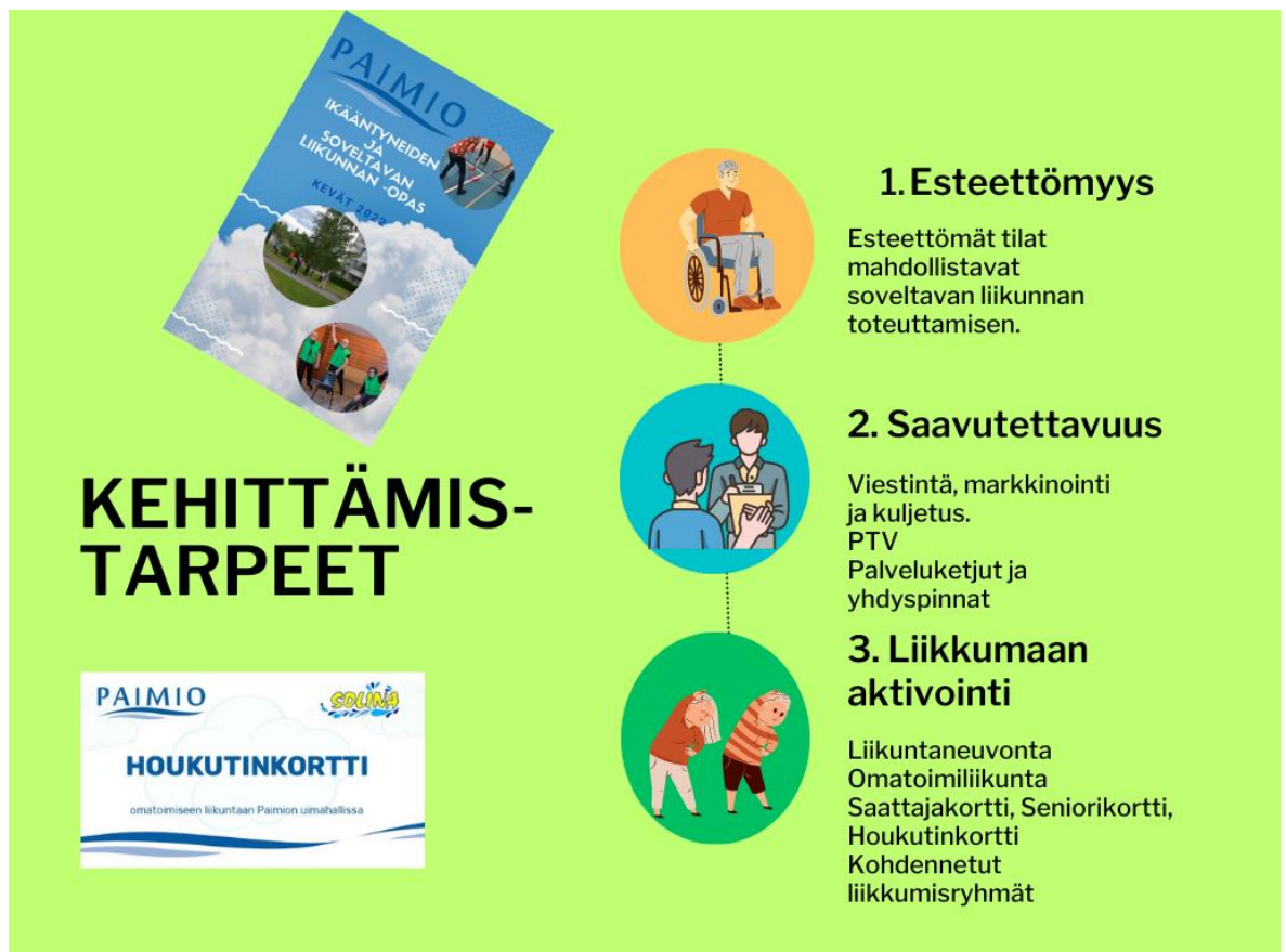
Kuvio 16. Kehittämistarpeet

Soveltavan liikunnan kohderyhmiin kuuluvat henkilöt liikkuvat vähemmän muuhun väestöön verrattuna. He kokevat myös enemmän esteitä liikunnan harrastamisessa, kuten esimerkiksi avustajan tai kuljetuksen puute tai sopivaa liikuntaryhmää ei löydy. Kunnan ja Varhan on hyvä tunnistaa potentiaaliset asiakkaat, ohjata liikuntaneuvontaan tai luoda saumaton palveluketju kuntoutuksesta liikuntaan.