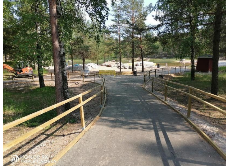
Kuvio 12. Vuonna 2023 valmistuva Hiekkahelmen esteetön uimaranta