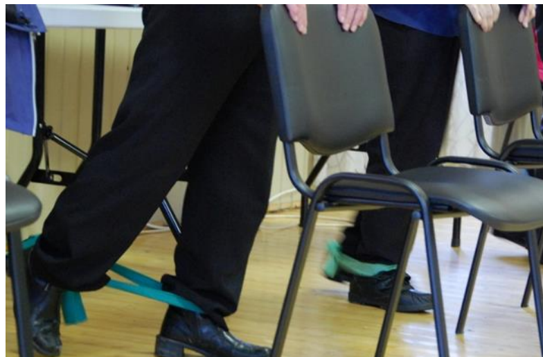
Kuvio 17. Ikääntyneiden tuoli tukena jumppa