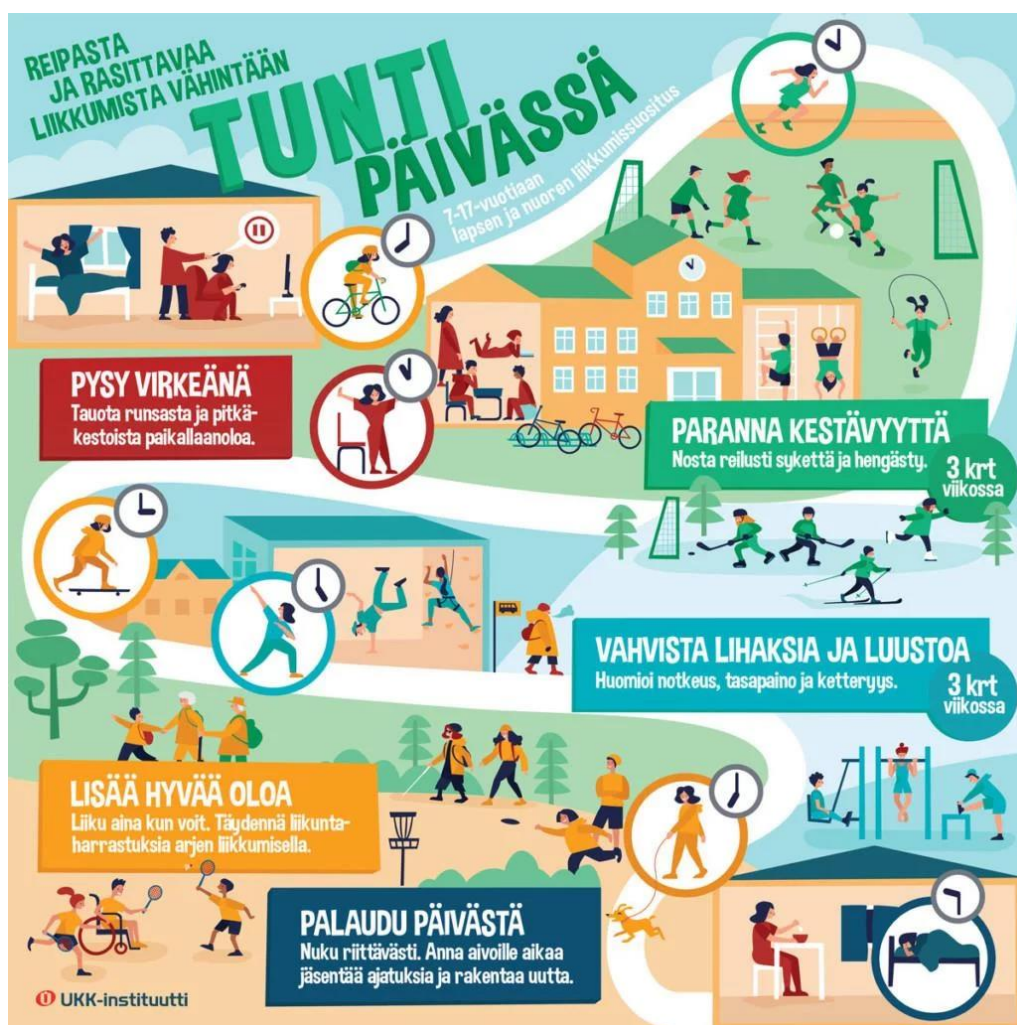
Kuvio 6. Lasten ja nuorten liikkumissuositukset (UKK-instituutti)