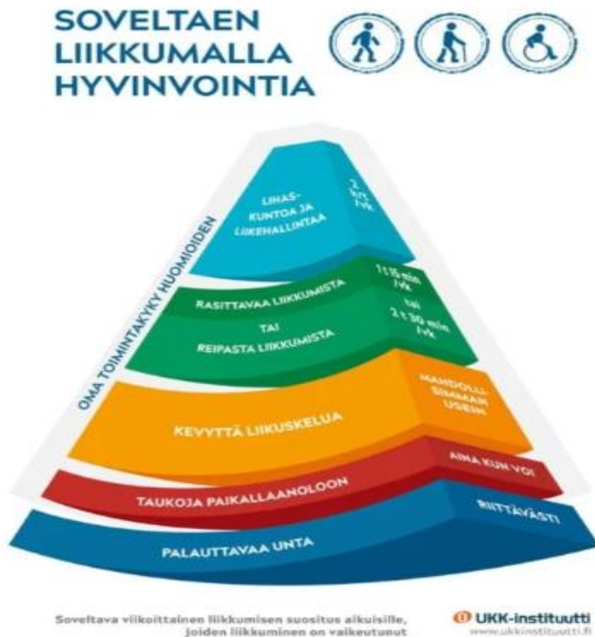
Kuvio 7. Soveltava viikoittainen liikkumisen suositus aikuisille, joiden liikkuminen on vaikeutunut (UKK -instituutti)

Soveltavan liikkumisen suositus on sydämen sykettä kohottavaa liikuntaa reipasta liikkumista 2 tuntia 30 minuuttia viikossa tai rasittavaa liikuntaa 1 tunti 15 minuuttia viikossa. Lisäksi lihaskuntoa ja liikehallintaa tulisi harjoittaa vähintään kaksi kertaa viikossa.