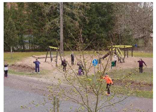
Kuvio 14. Parvekejumppaa taloyhtiön pihalla

Onnistunut terveyttä ja hyvinvointia edistävä soveltavan liikunnan kehittämistyö vaatii jatkossakin hyvää monialaista yhteistyötä ja eri toimintojen yhdistämistä, kuten esimerkiksi kulttuurikävelyt, jossa yhdistetään kulttuuria sekä liikuntaa ikääntyneiden ehdolla. Eri toimintamallit ja -tavat, joilla houkutellaan soveltavan liikunnan kohderyhmään kuuluvia liikkeelle ovat tervetulleita. Soveltavan liikunnan kehittämistyö ja juurruttaminen osaksi eri toimijoiden ja palveluiden arkea vaatii myös koulutusta, innovatiivisuutta sekä resursseja.