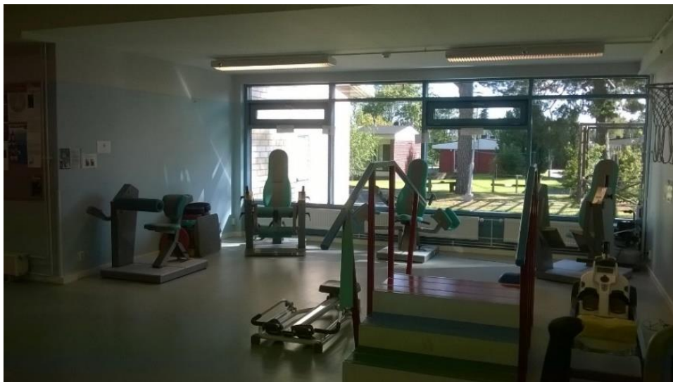
Kuvio 11. Paltanpuiston esteetön kuntosali