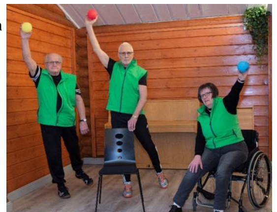
Kuvio 9. Vertaisliikuttajat