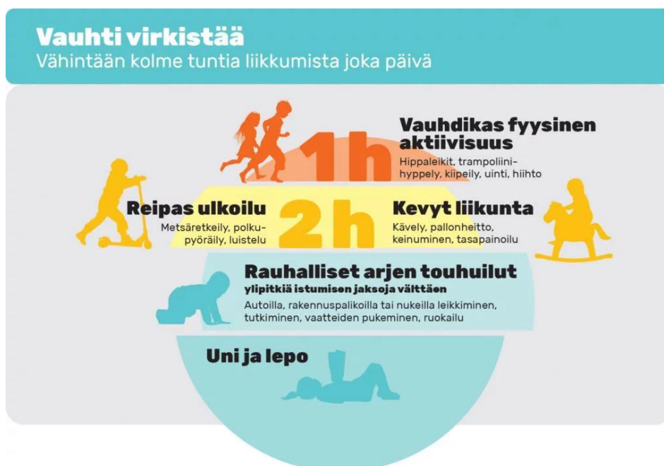
Kuvio 5. Vauhti virkistää. Varhaisvuosien fyysisen aktiivisuuden suositukset 2016. (Opetus- ja kulttuuriministeriö)

Suosituksissa nostetaan esille perheen merkitys tärkeänä roolimallina. Kannustava ilmapää, monipuolinen liikunta houkuttelevassa ympäristössä ja onnistumisen elämykset kannustavat ja innostavat lasta sekä koko perhettä liikkumaan.