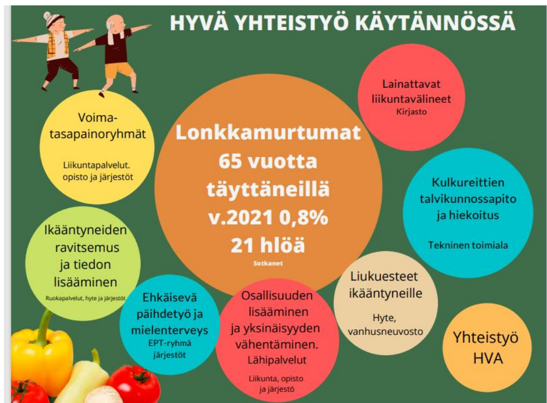
Kuvio 19. Hyvä yhteistyö käytännössä

Paimiossa on ollut hyvällä tasolla ikääntyneiden liikuntapalvelut ja tästä hyvästä tasosta on jatkossakin pidettävä huolta. Soveltavan liikunnan muiden kohderyhmien osalta liikuntapalveluita on syytä kehittää. Tarvitaan lisää soveltavasti liikunnasta innostuneita ohjajia, esteettä liikuntatiloja sekä oikeaa asennetta. Vaaditaan hyvää strategista johtamista sekä tarkoituksenmukaisia toimenpiteitä huomioon ottaen soveltavan liikunnan kohderyhmän tarpeet, käytettävät resurssit. Ikääntyneiden ja soveltavan liikunnan kohderyhmän hyvinvoinnin ja terveyden edistäminen vaatii jatkossakin monialaista yhteistyötä eri toimijoiden kanssa sekä sujuvaa yhteistyötä tulevan hyvinvointialueen kanssa.