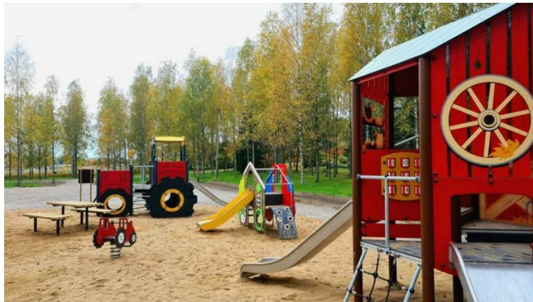
Kuvio 13. Vuonna 2021 valmistunut Hanhen leikkipuisto