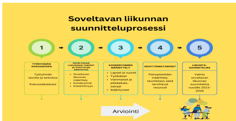
Kuvio 2. Soveltavan liikunnan kehittämistyön prosessikaavio

Strategian vastuutaho on Paimion liikuntapalvelut. Soveltavan liikunnan strategia tulee osaksi Paimion kaupungin liikuntasuunnitelmaa