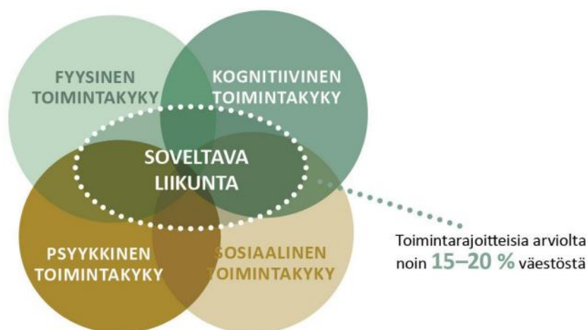
Kuvio 1. Soveltavan liikunnan kohderyhmä (Rikala s. Liikuntatieteellinen seura 2018)

Ikääntyneiden määrä tulee kasvamaan Paimiossa tulevien vuosien aikana merkittävästi. Tämä johtuu osittain siitä, että ihmiset elävät entistä pidempään. Sotkanetin mukaan vuoden 2020 loppuun mennessä paimiolaisista 22,3 prosenttia oli yli 65-vuotiaita. Heistä yli 75 vuotta täyttäneitä henkilöitä 1007 ja 80 vuotta täyttäneitä 556 henkilöä. Ennusteiden mukaan vuonna 2030 Paimiossa on yli 80 vuotta täyttäneitä 1014 henkilöä. Samalla arvioidaan erilaisia toimintarajoitteita kokevien ihmisten määrän kasvavan. Väestön ikääntyessä palveluiden ja erityisesti raskaiden ja korjaavien palveluiden määrä tulee kasvamaan.