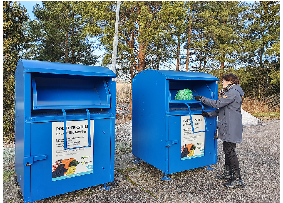
Puhtaat ja kuivat poistotekstiilit pakataan muovipussiin, joka suljetaan huolellisesti ja laitetaan keräysastiaan.

Lounais-Suomen Jätehuolto Oy kokeilee poistotekstiilin jalostusta pilottivaiheen käsittelylinjastolla, joka sijaitsee Paimion Green Field Hubissa, Jukantiellä. LSJH:n linjasto jalostaa kotitalouksien poistotekstiilit mekaanisesti kierrätyskuiduksi, jota yritykset voivat käyttää tuotteidensa raaka-aineina. Tavoitteena on löytää eri tekstiilivirroille paras mahdollinen kiertotalouden mukainen käsittelyratkaisu. Kierrätyskuiduista valmistetaan esim. kierrätysvillalankaa, pellava- ja puuvillapyyhkeitä sekä muita