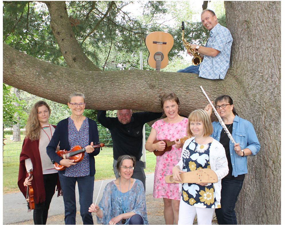
Olkoon juhla tai arki, niin musiikkiopiston opettajien hymy ei hyydy!

Myöhemmin keväällä ja kesällä on tulossa ainakin parvekekonsertteja ja puistomuskareita. Syksy on suunnitelmisammme mm. entisten opettajien konsertti, juhlavastaanotto, soiva taidenäyttely ja ties vielä mitä. Seuraa ilmoittelua Paimion opiston facebook-sivuilla ja Kunnallislehden Paimion kaupunki tiedottaa -liitteissä!