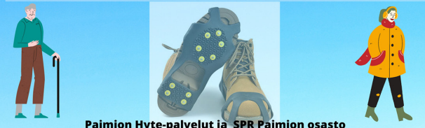
Paimion Hyte-palvelut ja SPR Paimion osasto

Liukusteita on jaossa rajoitettu määrä. Varaudu esittämään henkilöllisyystodistus. Tule tutustumaan SPR:n turvalaukkuun, Voimareppuun sekä kuntosaliiin!