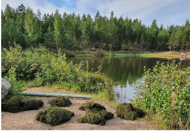
Hiekkahelmestä poistettuja kiehkuravesiruttokasvoja kuivattiin hetki rannalla ennen säkitystä ja jätteenkäsittelyä.

Tulevassa torjuntahankkeessa aikeena on tyhjentää Ankkalampi. Kalat poistetaan