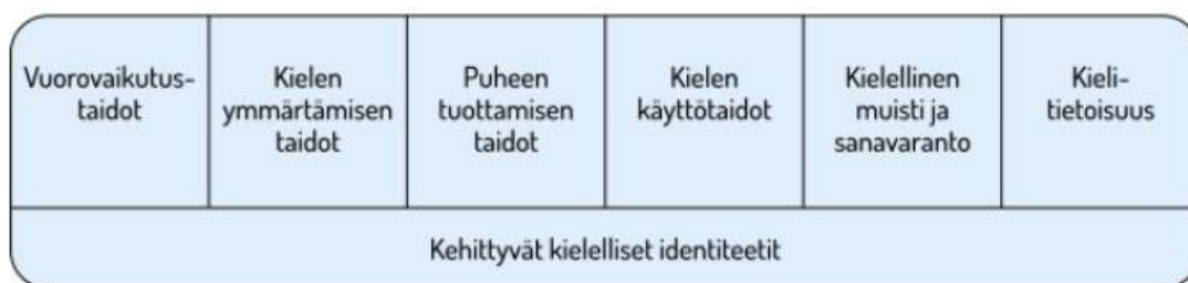
KUVIO 1. LASTEN KIELEN KEHITYKSEN KESKEISET OSA-ALUEET ESIOPETUKSESSA

Kielen oppimisen kannalta on tärkeää tiedostaa, että saman ikäiset lapset voivat olla eri vaiheissa kielen kehityksen eri osa-alueilla. Lasten kielelliset identiteetit kehittyvät, kun heitä ohjataan ja tuetaan kielellisten taitojen ja valmiuksien keskeisillä osa-alueilla.