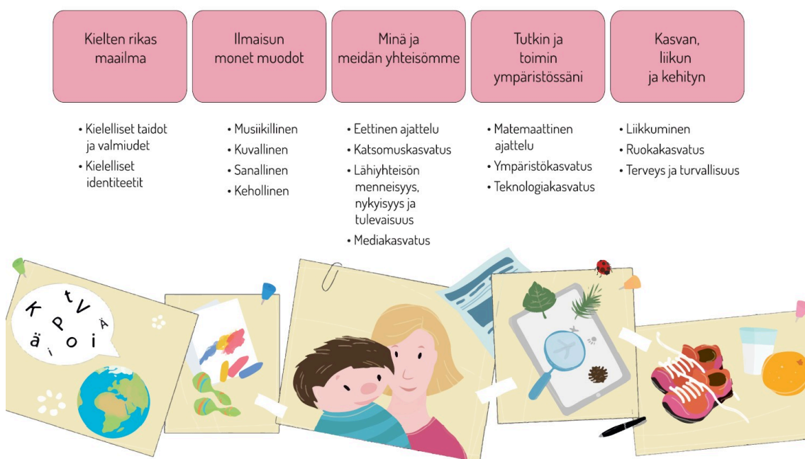
Kuva 5: Oppimisen alueet. Opetushallitus-Perusteet, oheismateriaali.