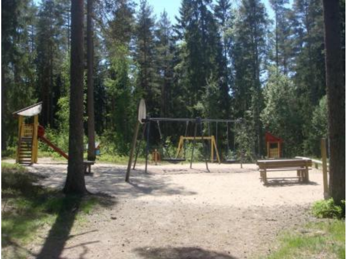
Kuva 2. Hossilantien leikkipuisto