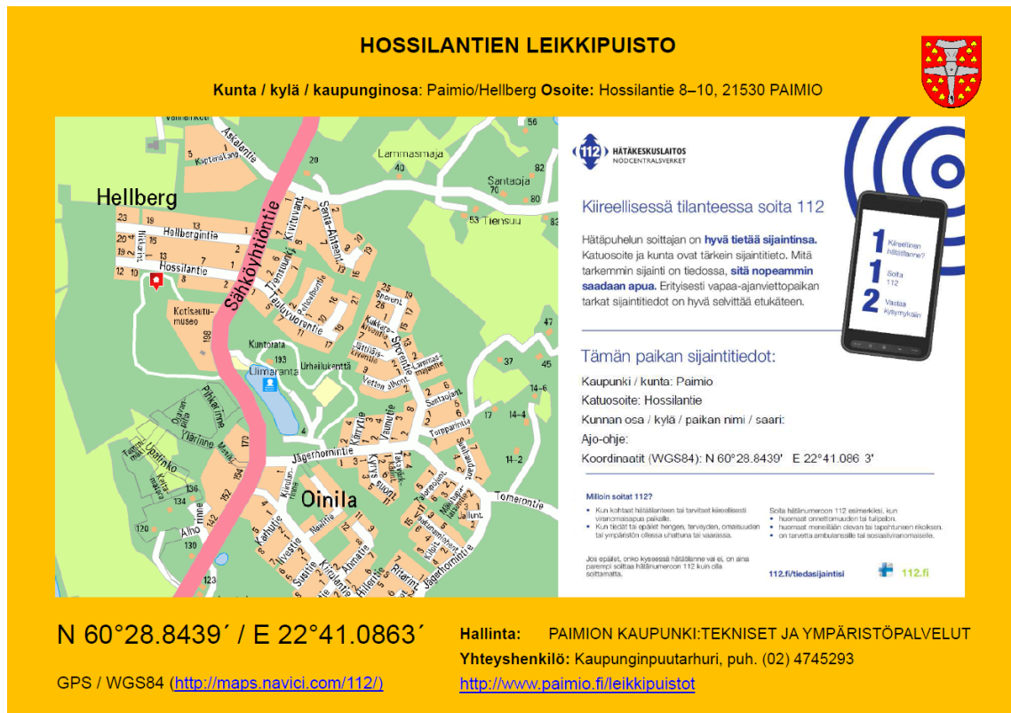
Kuva 1. Hossilantie 8-10 sijaitsevassa leikkipuistossa oleva huomiotaulu.

Käyntiosoite: Vistantie 18 Postiosoite: PL 50 21531 PAIMIO Aukioloajat: ma-ti, to-pe 8 – 15.30, ke klo 10 – 15.30 Sähköposti: etunimi.sukunimi@paimio.fi